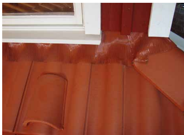
Bild 2: Montering av vägganslutning. På bilden syns även Luftningspannan, se texten.